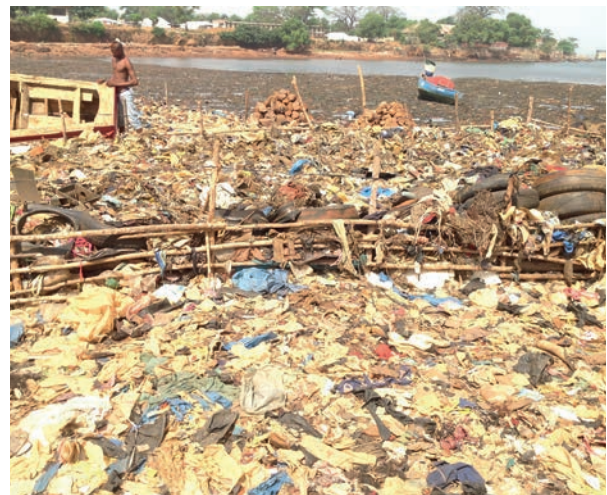
Kunststoffabfälle in Sierra Leone, die zur Regenzeit ins Meer gespült werden.

KuWert setzt somit an der Quelle des Problems an: Durch neue Verwertungsmöglichkeiten vor Ort schafft das Konzept Anreize, den in Haushalten und der Wirtschaft anfallenden Plastikmüll zu sammeln, sodass dieser erst gar nicht in Umwelt und Meere gelangt. Zusätzlich werden werthaltige Sekundärrohstoffe gewonnen. Diese können durch den mobilen Charakter der Abfallbehandlung, die