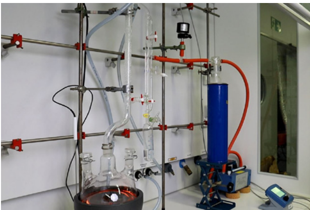
Aufreinigung des Kondensats mittels Destillation im Labormaßstab.

basierete Monomer. Dies erlaubt die erneute Polymerisation zu Polystyrol in Lebensmittelqualität und damit lässt sich der Kreislauf schließen.